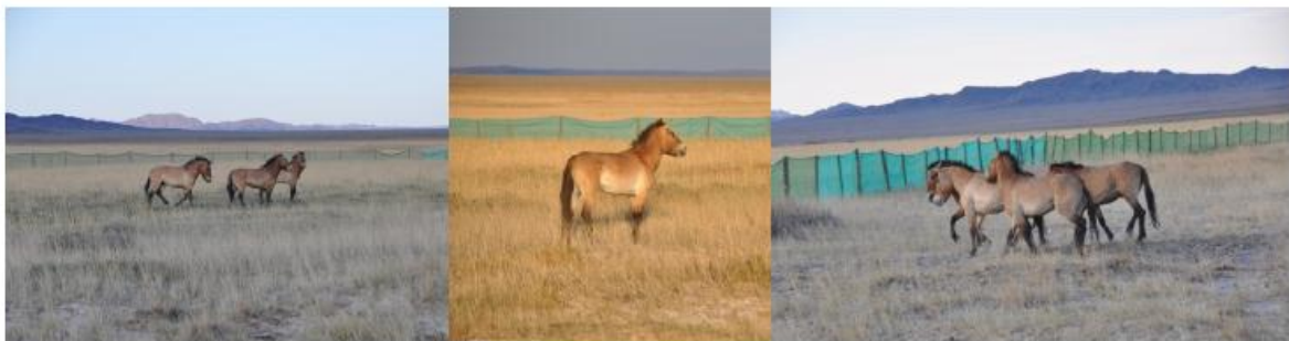
The takhis are in new place in Gobi B